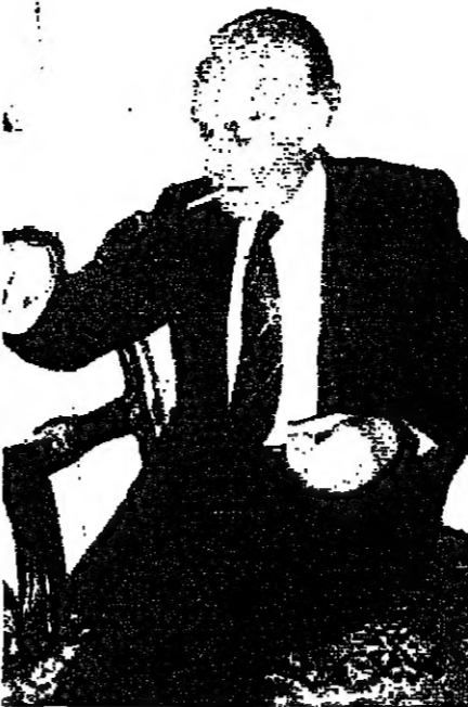
جورج مصروعة يا ثقافة اجديتيا

الجنية، وضوء التطلع الى غد افضل، وودر... الصفاة، وسائل التربية الفضل... قال رياض: الثقافة اللبنانية ليست عقل، بل... شهداء مدرسة... وقال: متى نخرج هذه الثقافة من كنفها، وتستعيد وعيها الحضاري؟